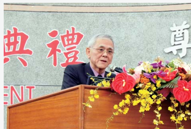
▲中研院吳成文院士蒞校演講

中央研究院吳成文院士受邀擔任今年典禮嘉賓,以畢業後的第一個疑問:「何去何從?」破題發表演講勉勵應屆畢業生:路是人走出來的,光明的前途掌握在自己手上,事業的抉擇目的是要滿足自己的人生,應該包含「物質上的滿足」、「情感上的滿足」、「智慧上的滿足」;而成功的條件更需要天時—配合時代走向、地利—社會的需求、人和—協力的團隊。院士也強調,在21世紀,生物醫學是重要的科學,生技產業是明星產業,知識經濟更是台灣的前途。